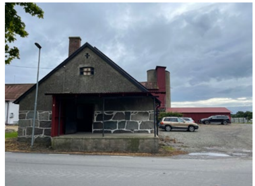
Till vänster karta över planerat område. Ovan den byggnad på Svabesholm som skulle kunna användas till utställningar, barnverksamhet m m Nedan miljöbilder från området.