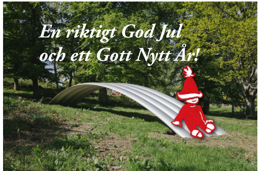
Årets verk Rainbow for Kivik av Jakob Dunkl.

PS! Du har väl inte glömt att betala årsavgiften för 2022? 200 kr per person till bankgiro 5636-6495