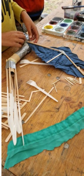
Land Arc Kids - bilder från barnverk- samheten 2023