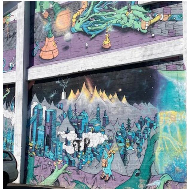
Detalj av väggmålning på Ifö Center.