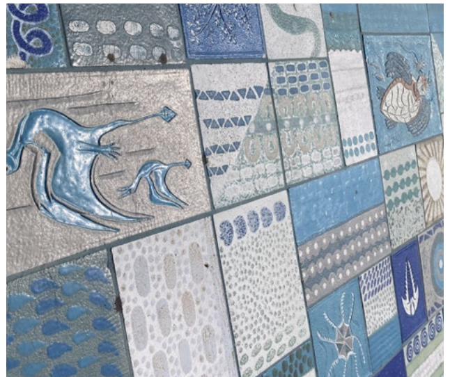
Scanisaurus, detalj av keramiken i fontänen.