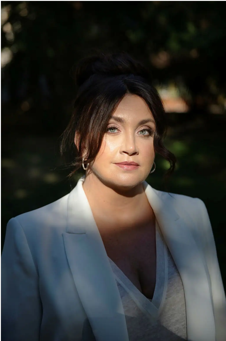
Camilla Läckberg har donerat pengar till Kivik Art Centre som ett svar på att Ulf Lundell uttryckt sig kritiskt om hennes böcker.

Men även efter det har skulpturen, i medierna mest känd som ”tornet”, fortsatt skapa publicitet.