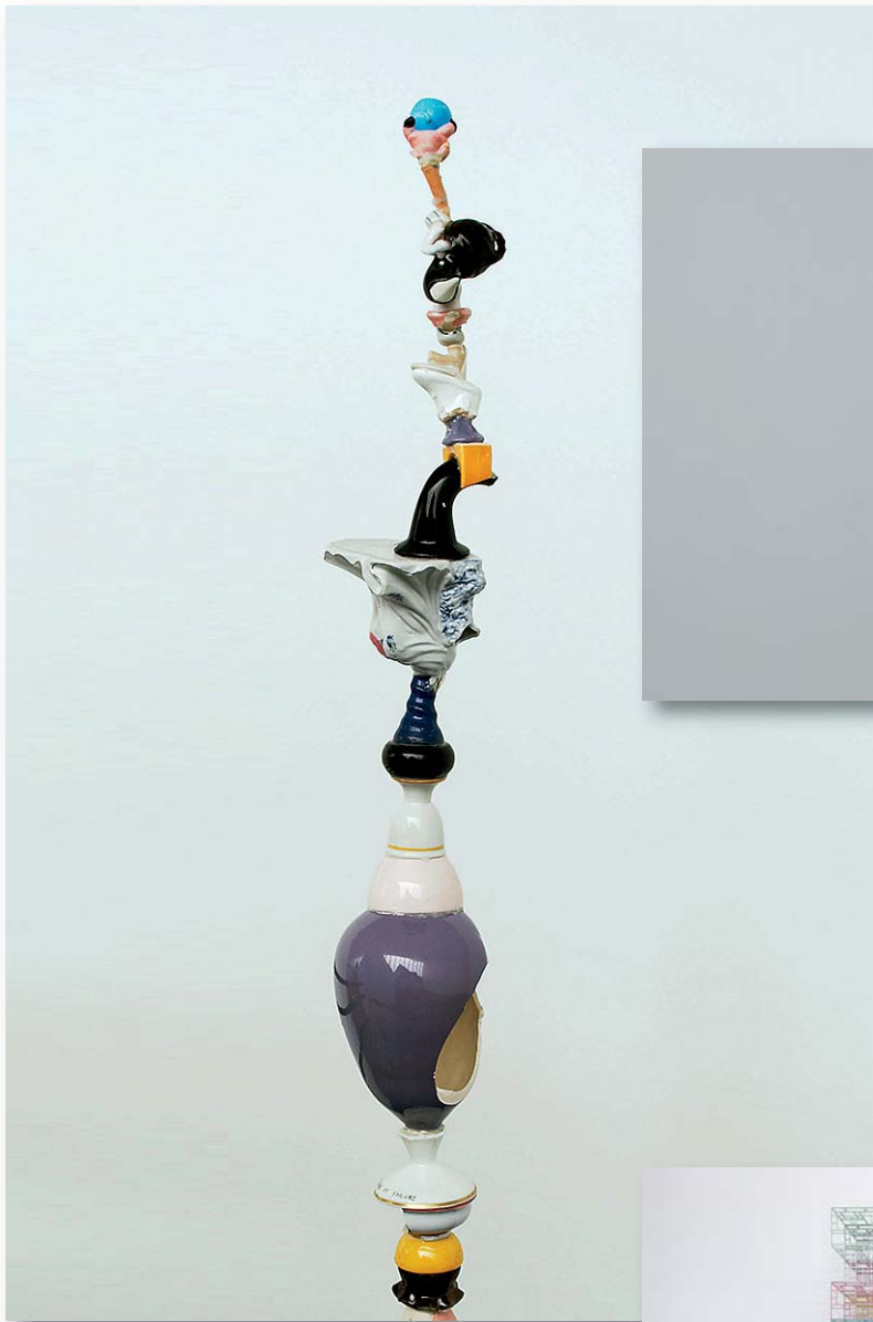
Sirous Namazi, Patterns of failure, detalj.