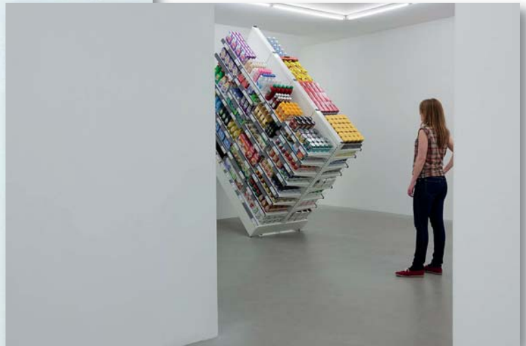
Sirous Namazi, Leaning Horizontal, 2012.