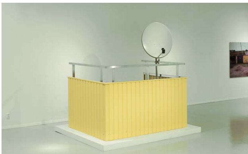
Sirous Namazi, Periphery, 2003, Moderna Museet.

Som medlem i INTRESSEFÖRENINGEN KIVIK ART kallas du härmed till ordinarie årsmöte söndagen den 3 april 2016 kl 11.00 på Ystads Konstmuseum, 2:a vån.