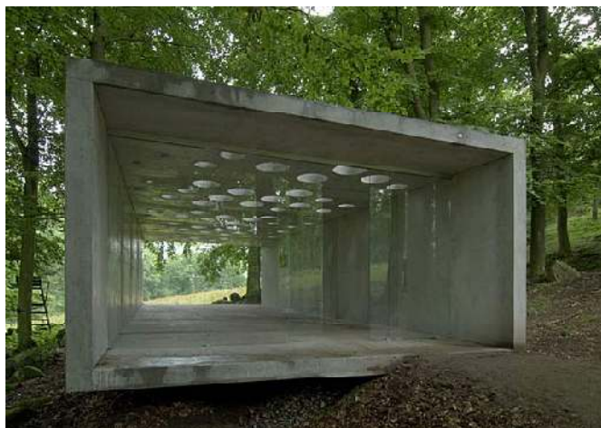
Snøhetta The mothership 2007