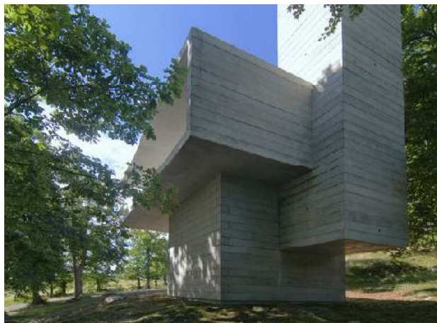
Chipperfield/Gormley Architecture for subjective experience 2008

Länsstyrelsen citerar fritt ur texten på Kivik Art Centres hemsida och påstår att det är stiftelsens egen beskrivning. Det är en försåtlig teknik som genom att utelämna viktiga passager kan ge en annan innebörd än den ursprungligt avsedda. Länsstyrelsen klipper samman två meningar från olika avsnitt, vänder på ordningsföljden. Utlämnar ord ur meningen. På hemsidan står t ex ” Skulpturen associerar slutligen också till platsens historia som militär anläggning, med sin karaktär av skyddsrum och torn för spaning”. I ett senare