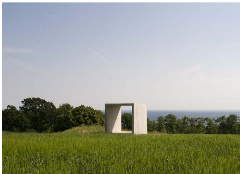
Snøhetta View-finder 2007

Snøhetta/Sandbergs två View-finders är kuber med två sidor öppna. De är gjutna i betong med måtten 240x240x240 cm. Båda är placerade i ett öppet landskap i siktlinje mot ett naturmotiv konstnärerna velat framhäva. Visuellt ger de båda objekten intryck av bildram. Det utsnitt man ser genom ramen förvandlar landskapet till en bild av sig självt.