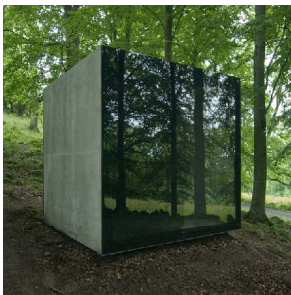
Snøhetta Photobox 2007

Snøhetta/Sandbergs Photobox I och II består också av öppna kuber. De är gjutna i samma form som de ovan nämnda View-finders men här är en silkscreentryckt bild laminerad mellan pansarglas och fastskruvad över en av de öppna sidorna. Silkscreentrycket är en förstoring av en av Tom Sandbergs fotografier. Det framställs som positiv bild i den ena boxen, som negativ i den andra. De båda betongelementen har ställts upp på linje mitt emot varandra i skogsmiljö. Glasen speglar den omgivande vegetationen och skapar därigenom ett mångfacetterat rum. Betongkuberna kan här närmast jämföras med ramar, som syftar till att rikta fokus på de fotografiska motiven och spegeleffekterna i glasen.